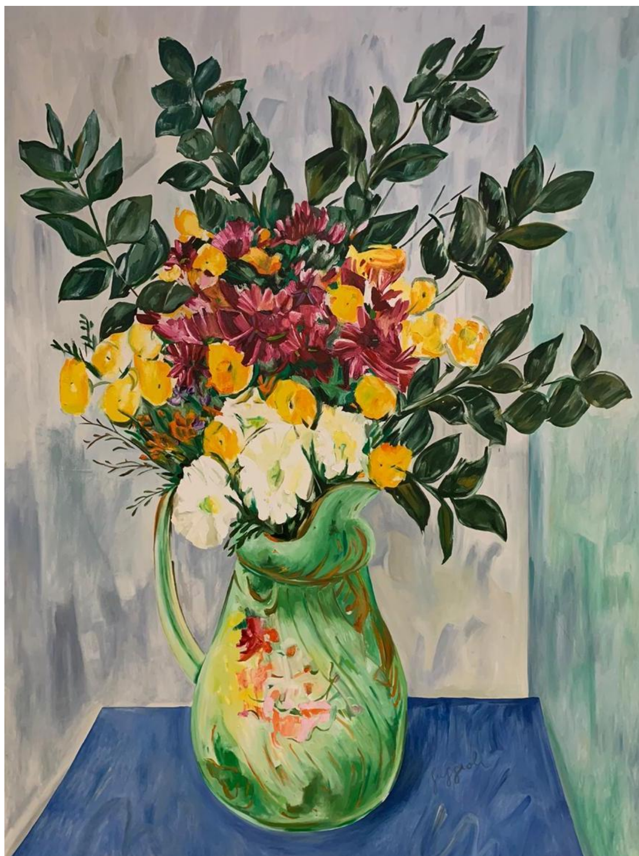
Sin título, 2017 Óleo sobre tela 270 x 200 cm USD 15.000 + IVA