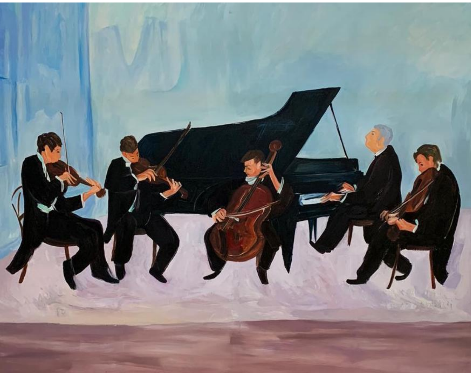
Sin título, 2017 Óleo sobre tela 200 x 250 cm USD 12.000 + IVA