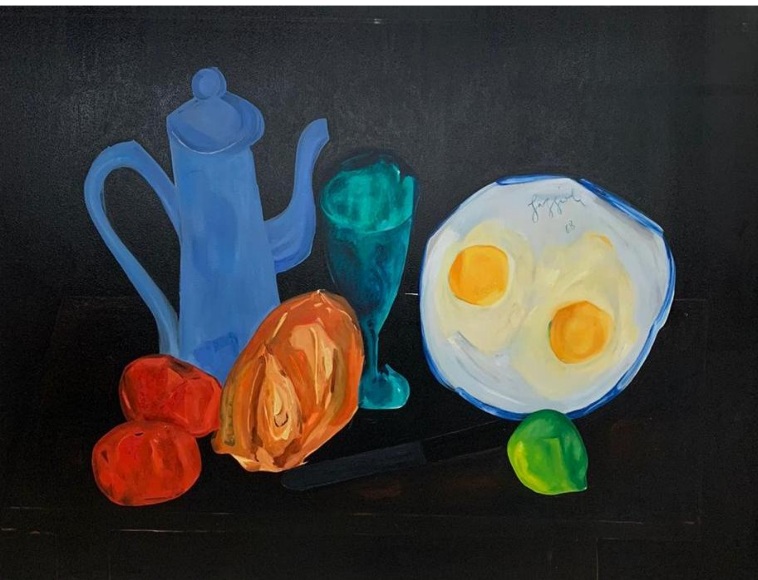
Sin título, 2017 Óleo sobre tela 190 x 250 cm USD 12.000 + IVA