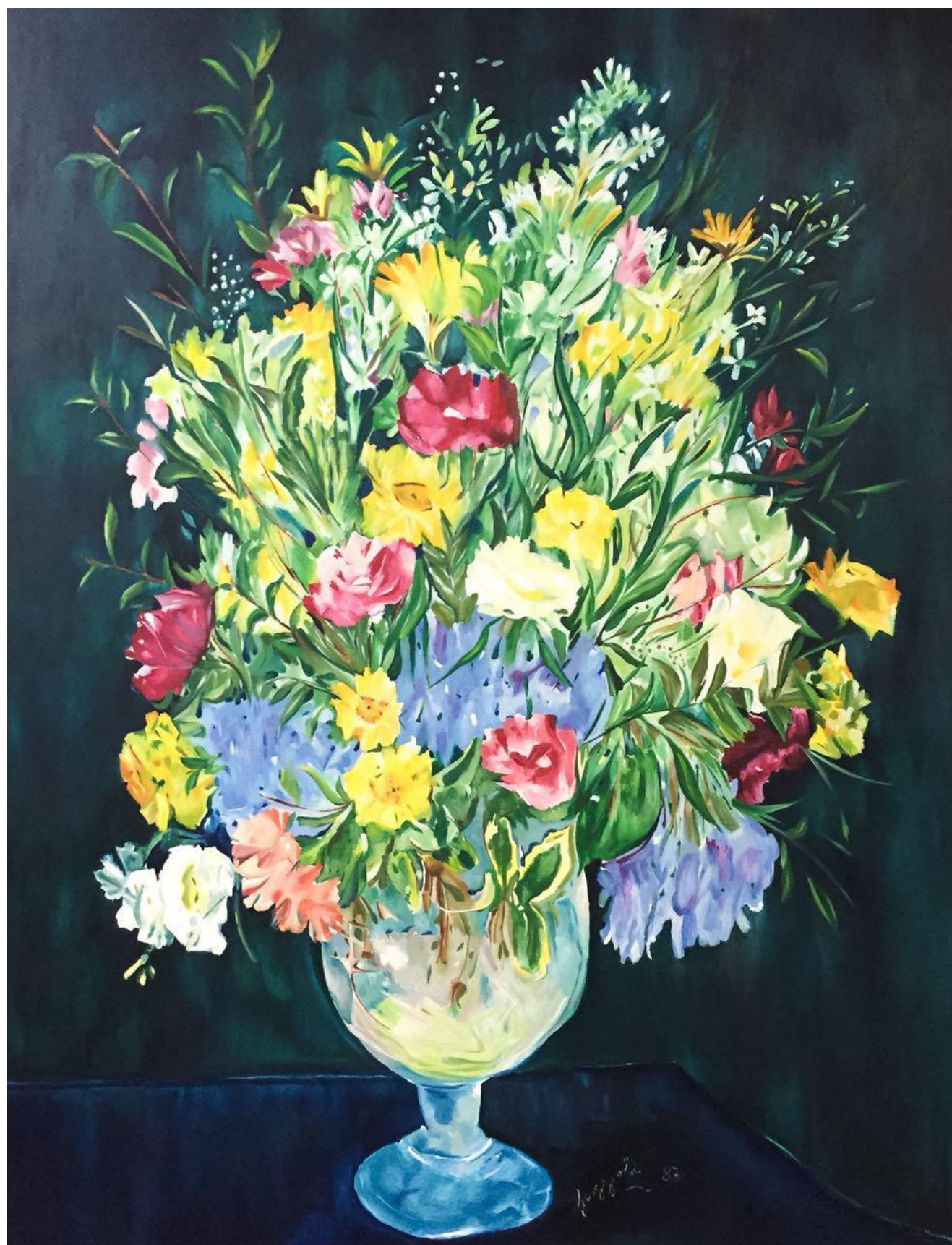
Sin título, 2017 Óleo sobre tela 200 x 170 cm Colección privada