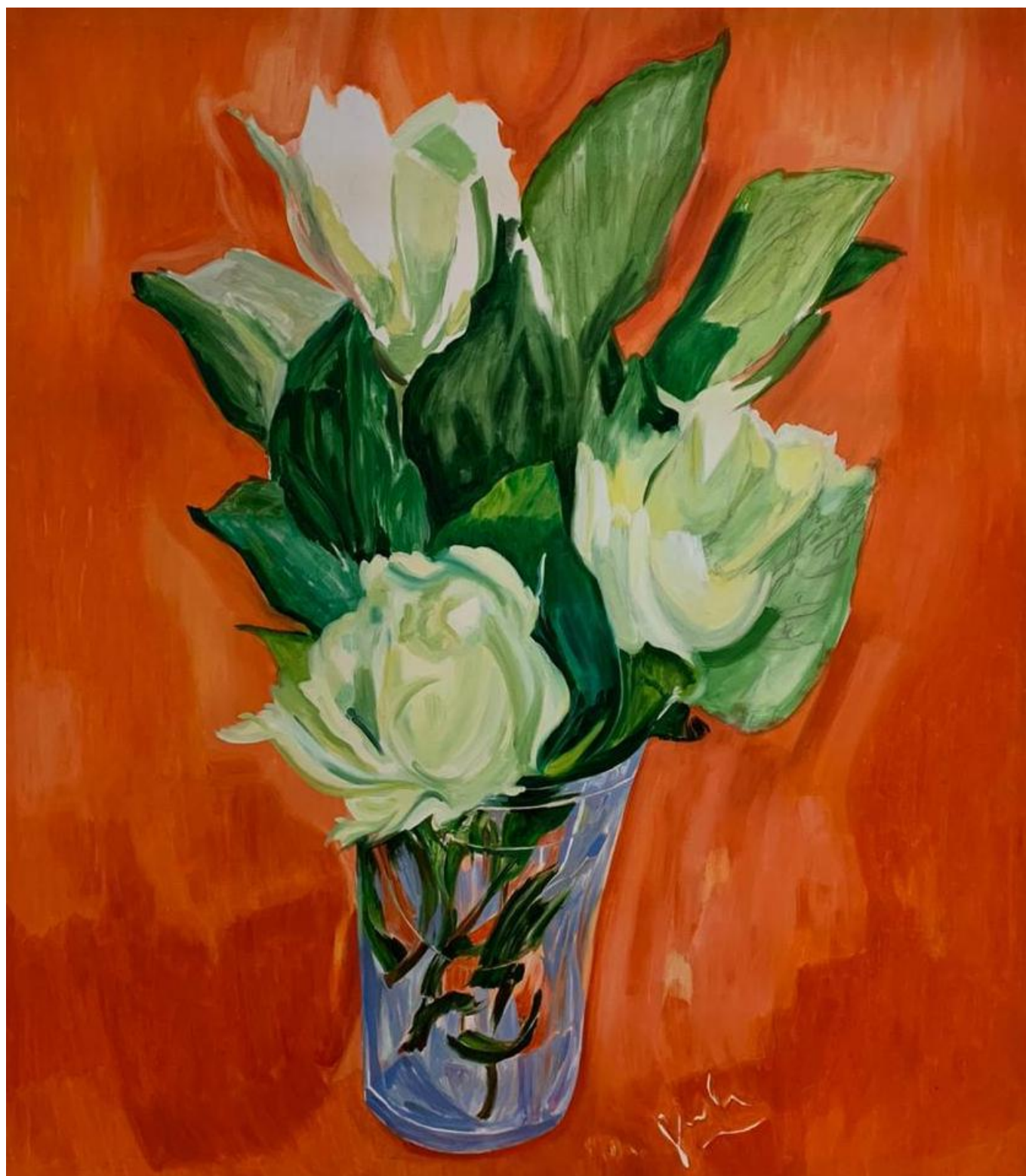
Sin título, 2017 Óleo sobre tela 170 x 150 cm USD 8.000 + IVA