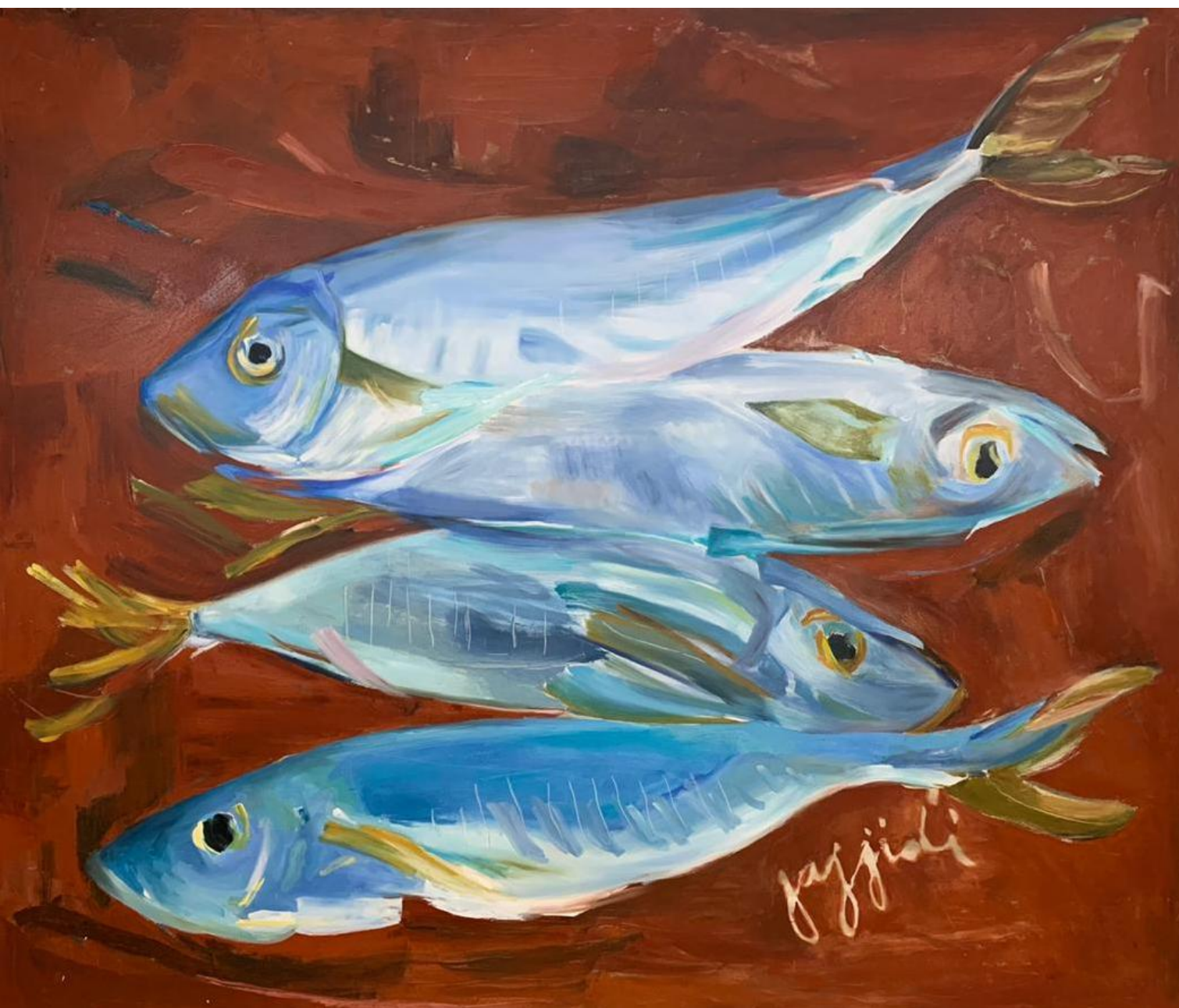
Sin título, 2017 Óleo sobre tela 170 x 200 cm USD 10.000 + IVA