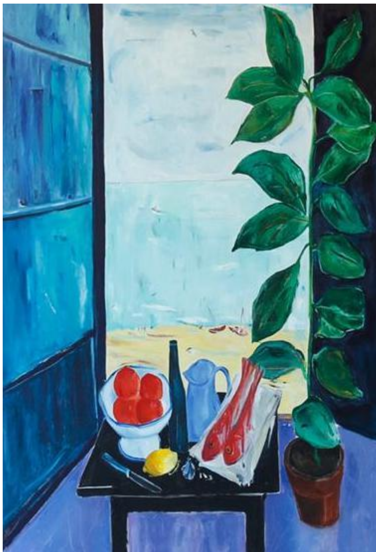
Sin título, 2019 Óleo sobre tela 200 x 135 cm USD 7.000 + IVA