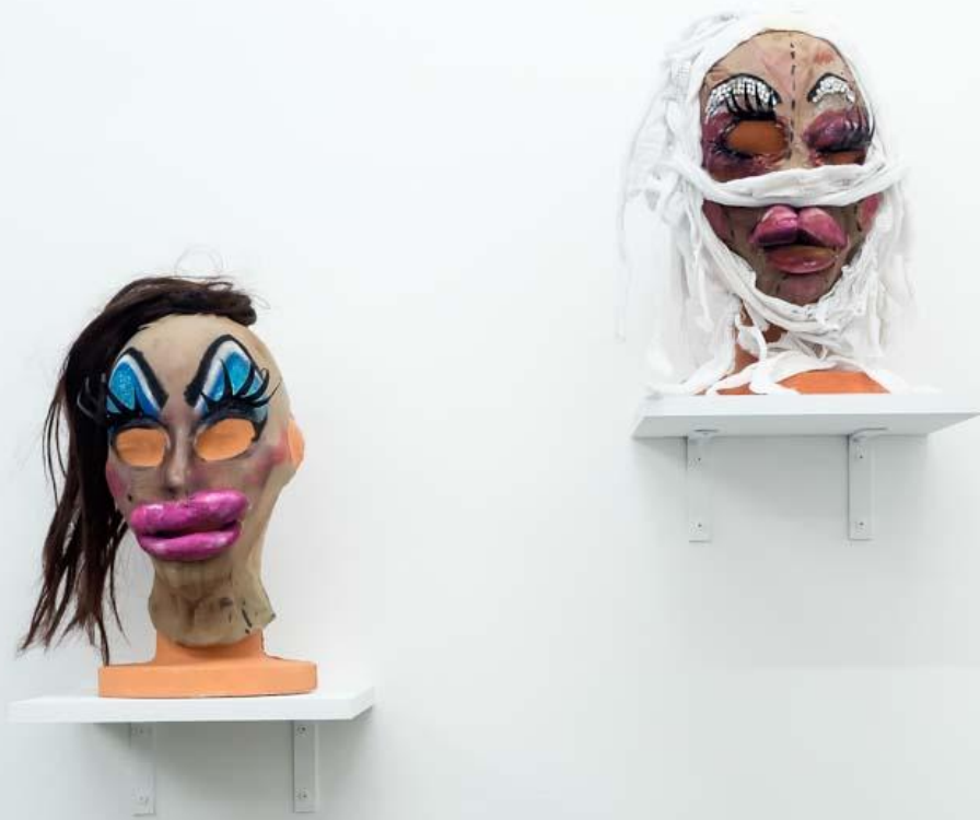
Franco Mala Sin Título, Máscaras intervenidas 35 x 30 cm.