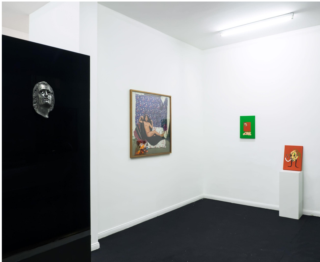
VISTA GENERAL DE LA EXHIBICIÓN