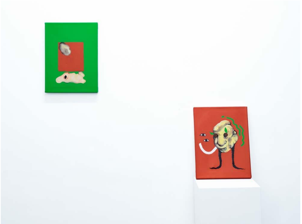
Mauricio Poblete Sin Título Acrílico sobre lienzo 40 x 30 cm. c/u