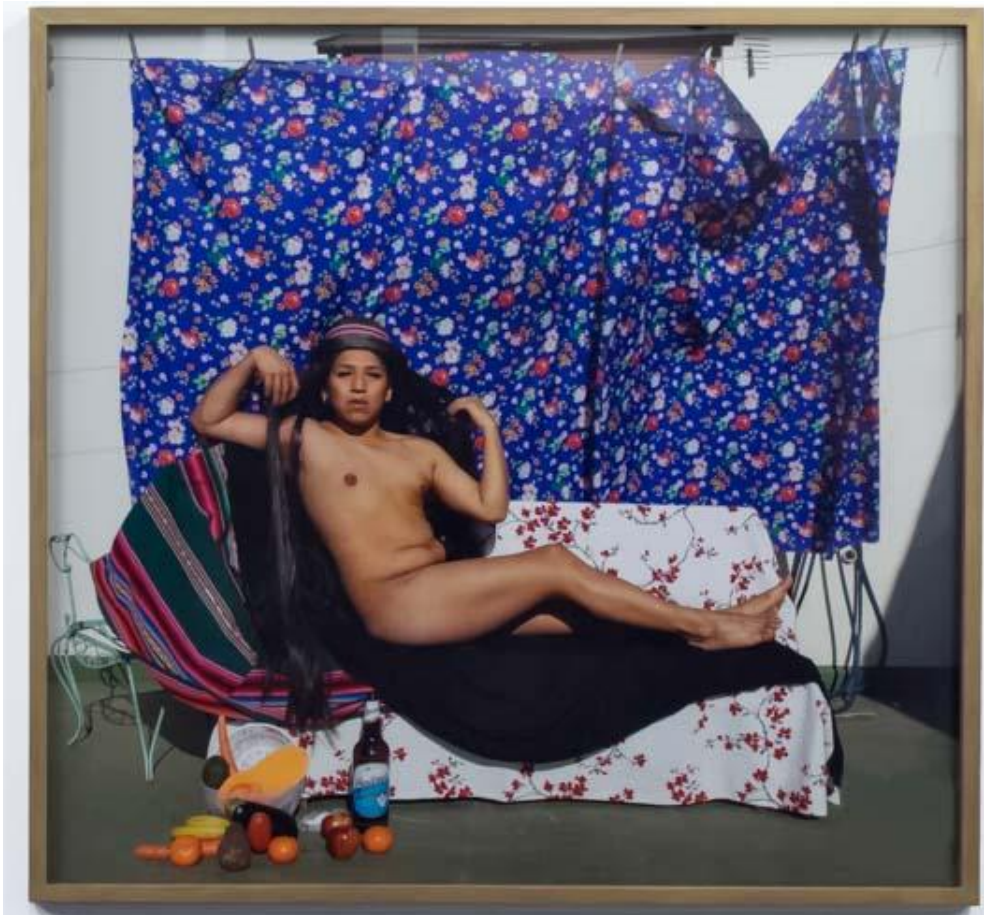
Mauricio Poblete Sin Título Fotografía 96 x 102 cm.