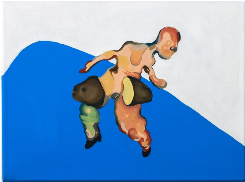
Mauricio Poblete Sin Título Acrílico sobre lienzo 40 x 30 cm.