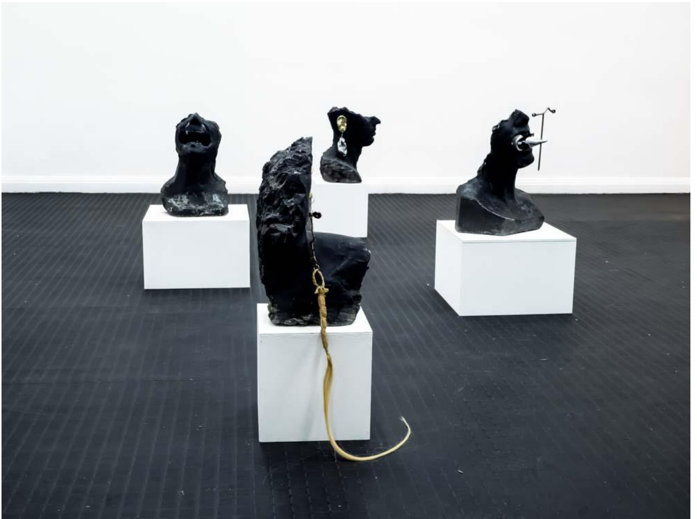
Andrés Piña. Sin Título. Yeso, cemento, aluminio, bronce 20x30 cm. c/u