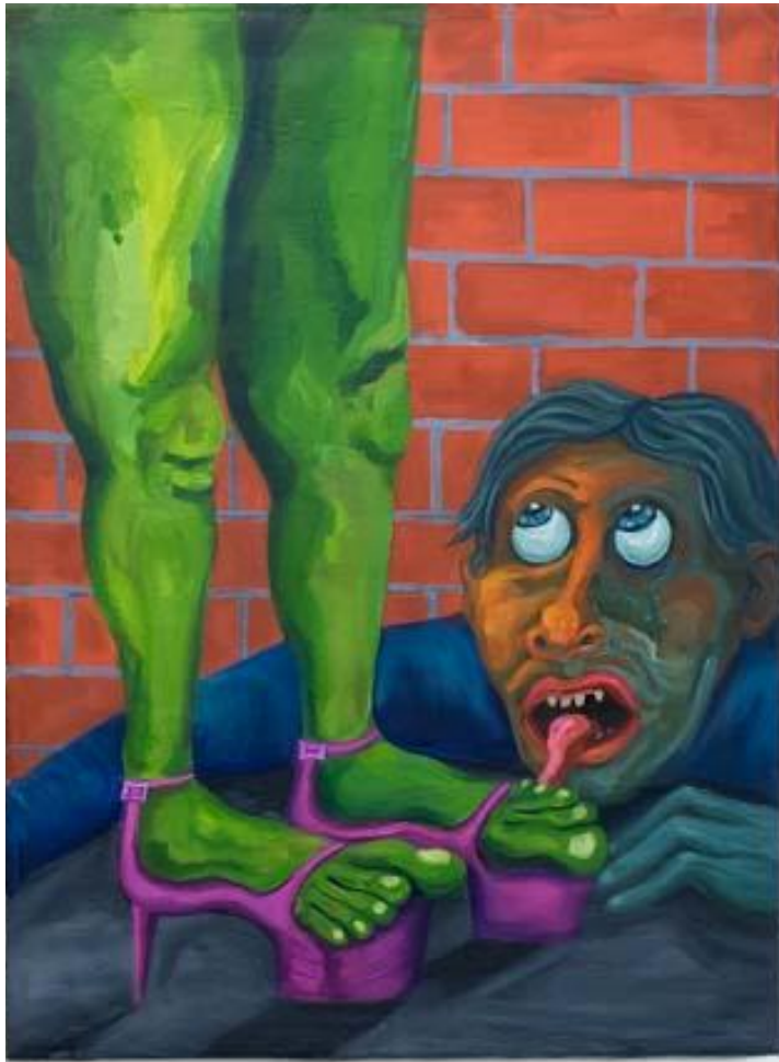
Franco Mala Sin Título, Serie fumadoras. Acrílico sobre lienzo 72 x 55 cm.