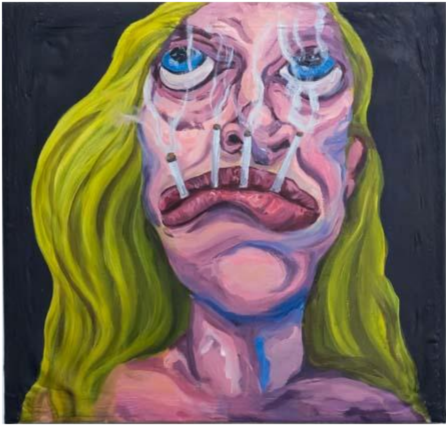
Franco Mala Sin Título, Serie fumadoras. Acrílico sobre lienzo 100 x 73 cm.