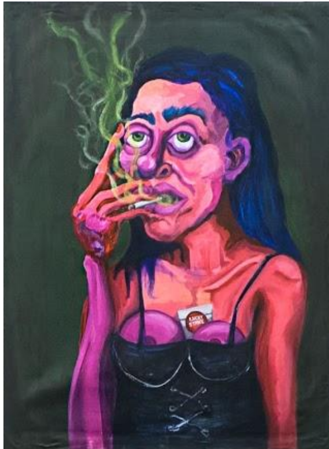
Franco Mala Sin Título, Serie fumadoras. Acrílico sobre lienzo 100 x 73 cm.