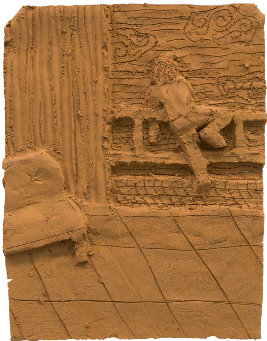
O es 3, 2020 Bajo relieve en barro del Rio Paraná cocido Low relief in Parana's River mud 10 piezas de 25 x 18 x 2 cm Colección Fundación Andreani