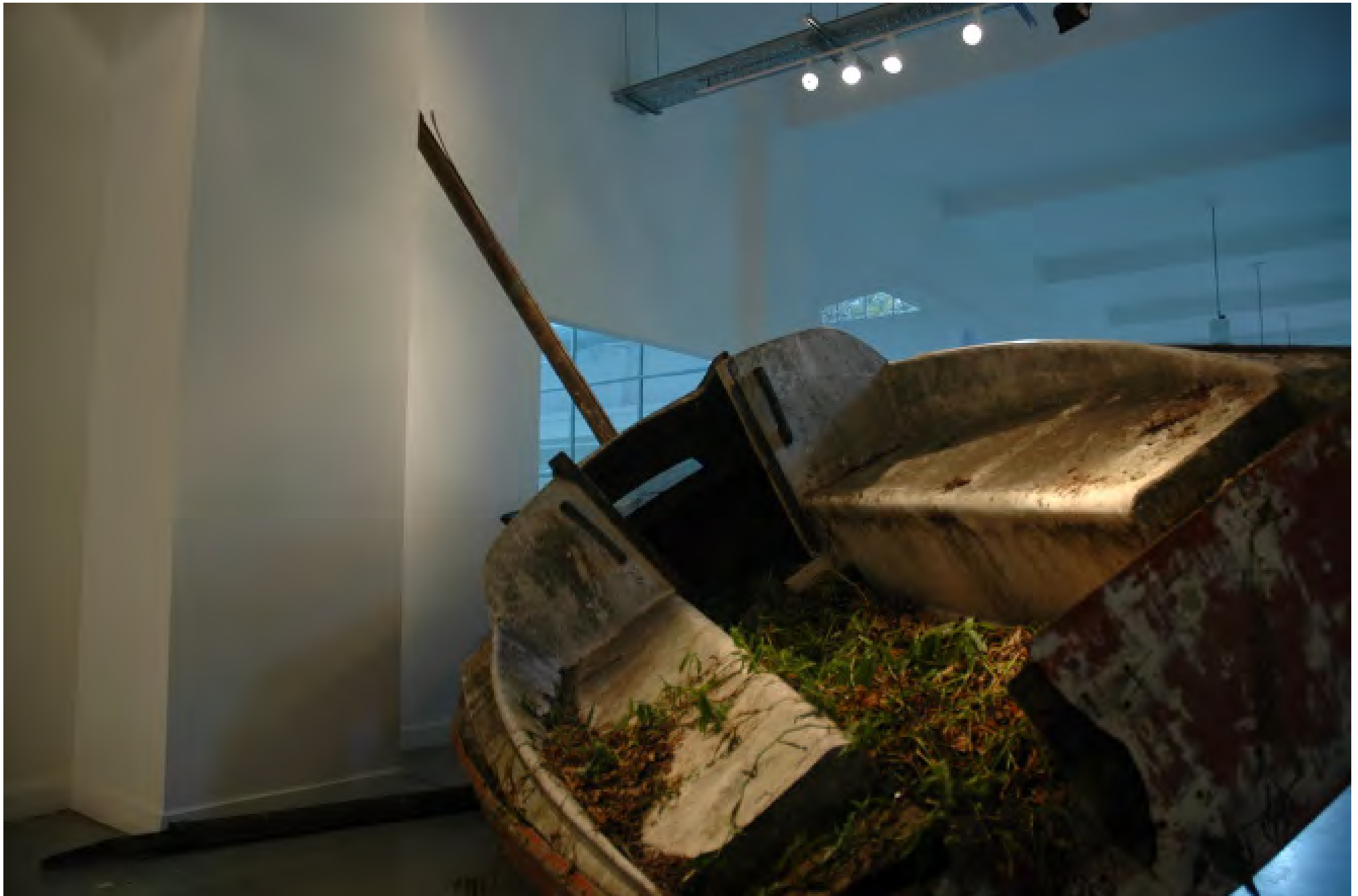
MAYDAY MAYDAY MAYDAY, 2014 / Instalación / Installation / 500 x 400 x 400 cm