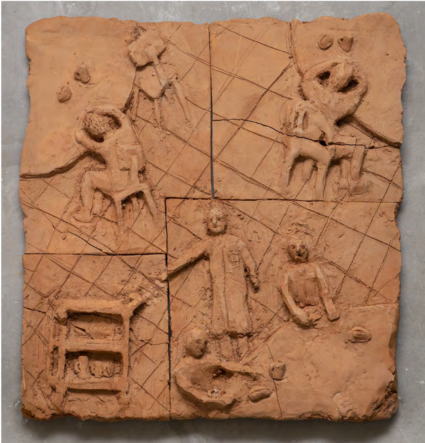
Desayuno, 2022 Bajo relieve en barro del Río Paraná cocido Low relief in Paraná's River mud 50 x 55 x 7 cm