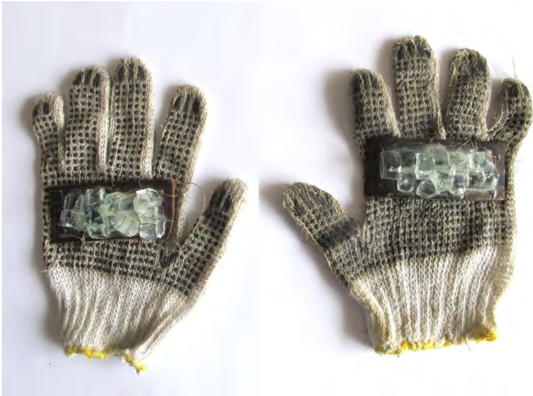
Estructura y adiestramiento, 2014 / Guantes, cuero y vidrio / Gloves, leather and glass / 30 x 50 cm / Colección Diego Benzacar