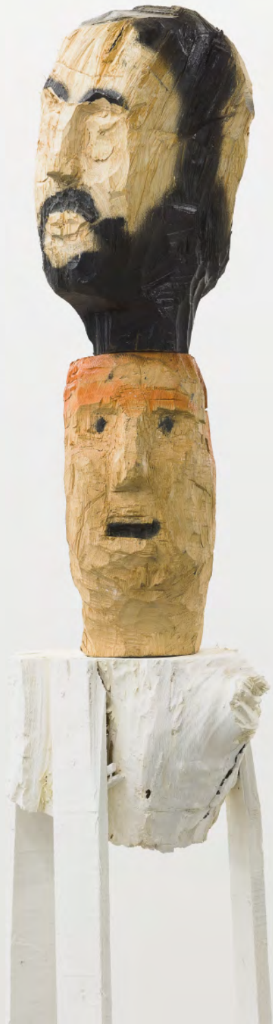
Nro 1, 2020 Talla en madera y pintura en aerosol Wood and spray painting 198 x 50 x 35 cm