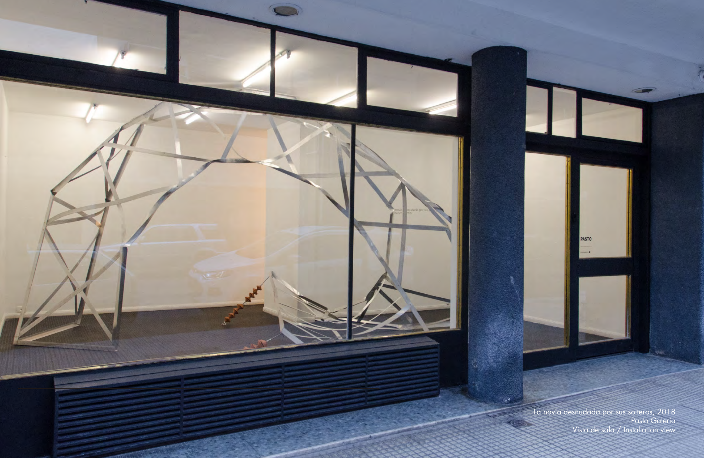
La novia desnudada por sus solteros, 2018 Pasto Galería Vista de sala / Installation view