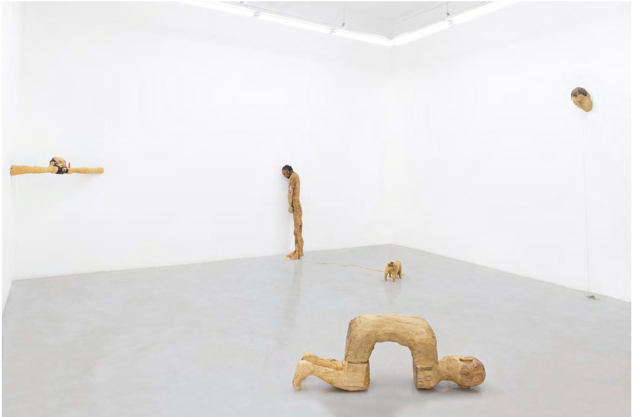
Tronca / Febrero - Marzo, 2023 / Vista de sala / Installation view / PASTO Galería