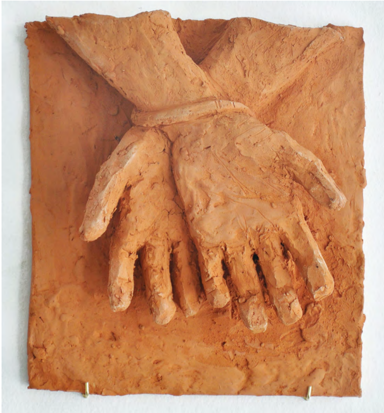
#2, 2021 Bajo relieve en barro del Río Paraná cocido Low relief in Paraná's River mud 27 x 24 x 7 cm