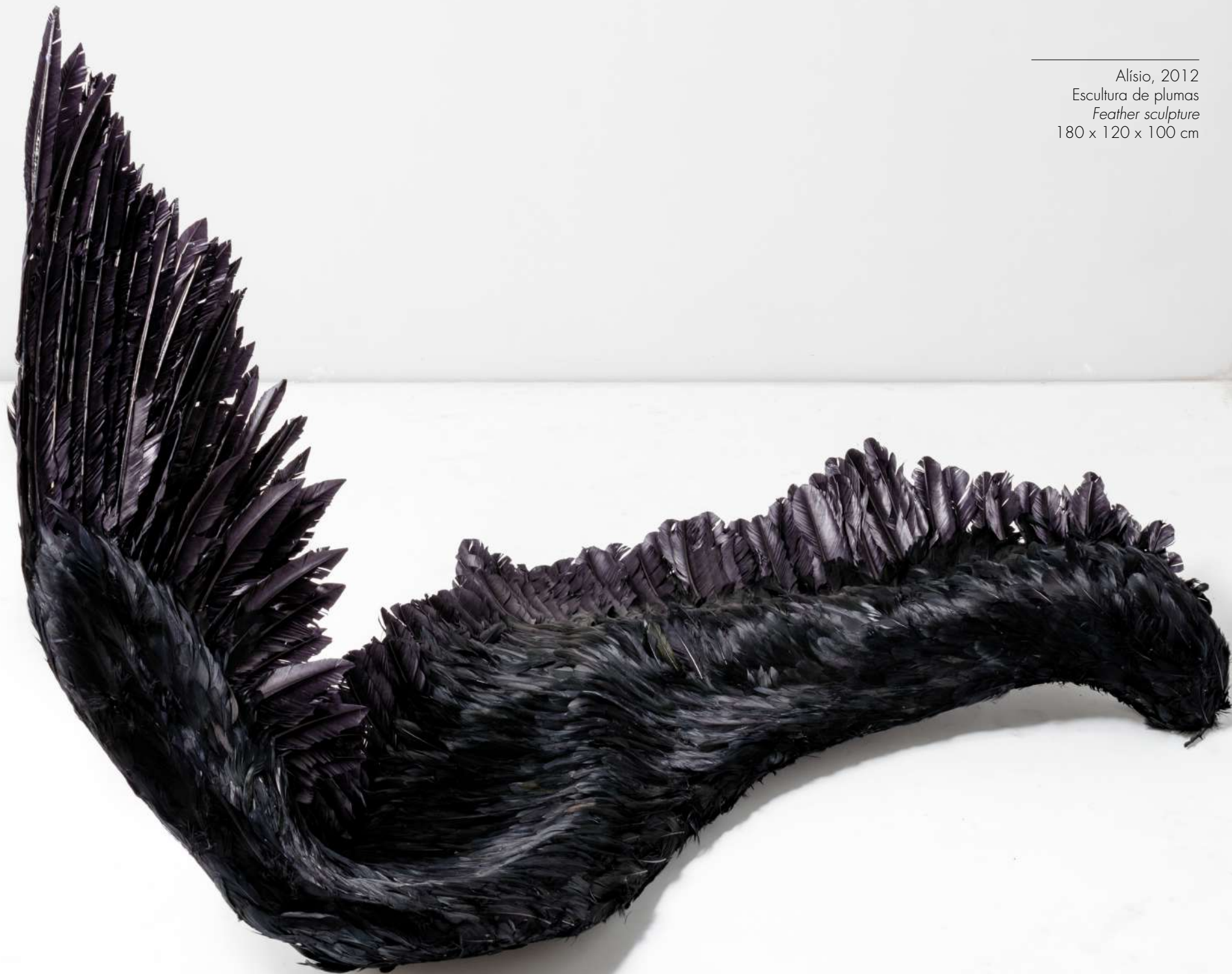
Alisio, 2012 Escultura de plumas Feather sculpture 180 x 120 x 100 cm