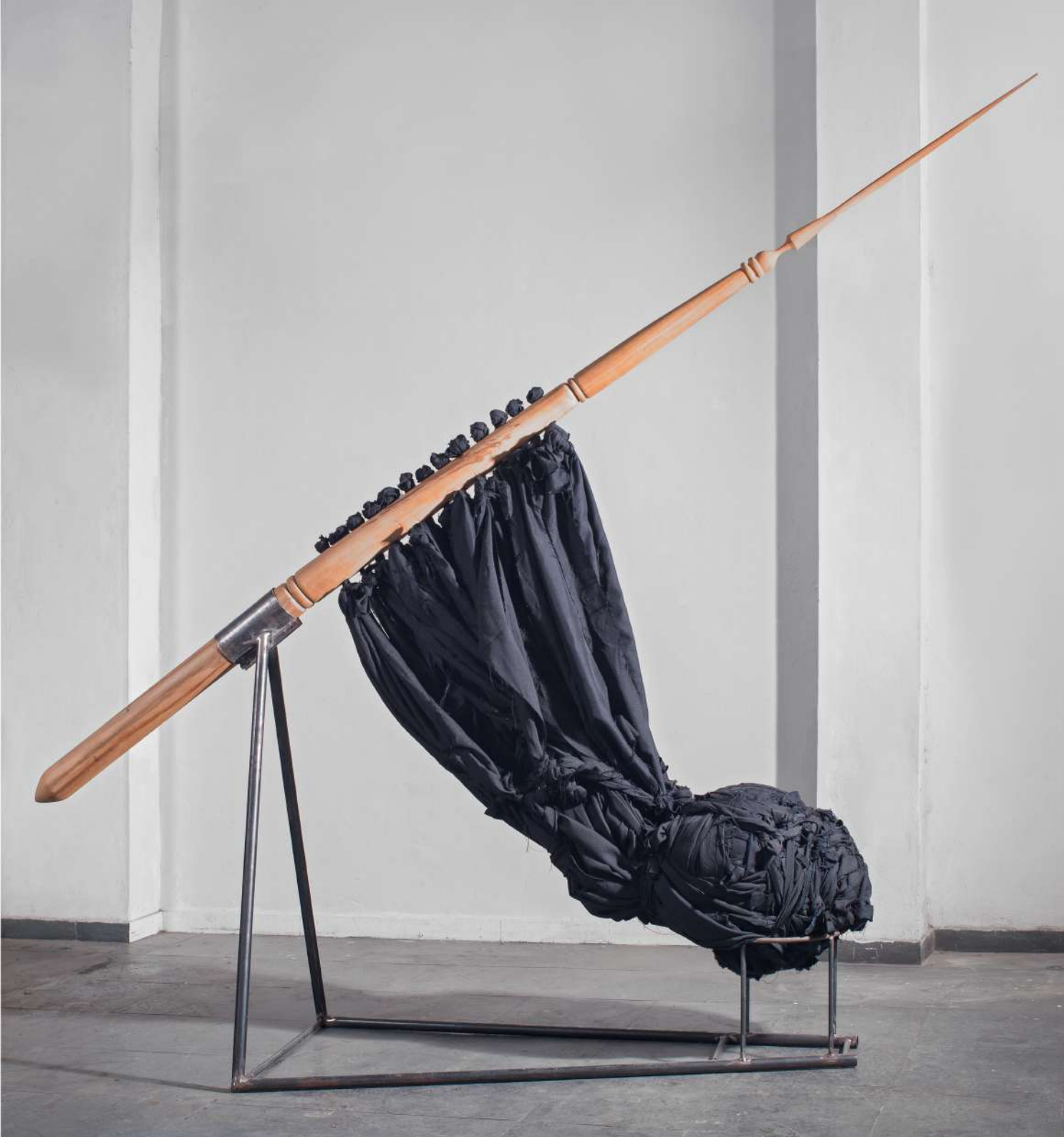
Besta cuadrada, 2017 Madera, algodón y hierro Wood, cotton and iron 300 x 320 x 70 cm