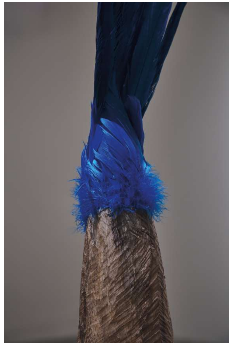
Rainha Azul, 2021 Oiti y pluma de faisán 132 x 30 x 27cm Colección Instituto Inhotim Minas Gerais, Brasil