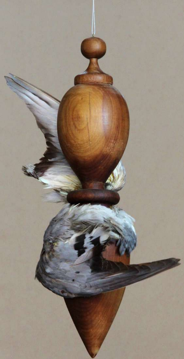
Prumo, 2014 Madera torneada y plumas Wood and feathers 45 x 35 x 20 cm