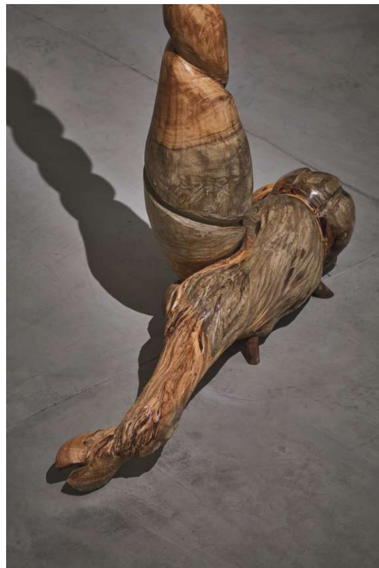
○ bom cabrito não berra, 2019 Eucalipto 146,5 x 67 x 22 cm Colección Instituto Inhotim Minas Gerais, Brasil