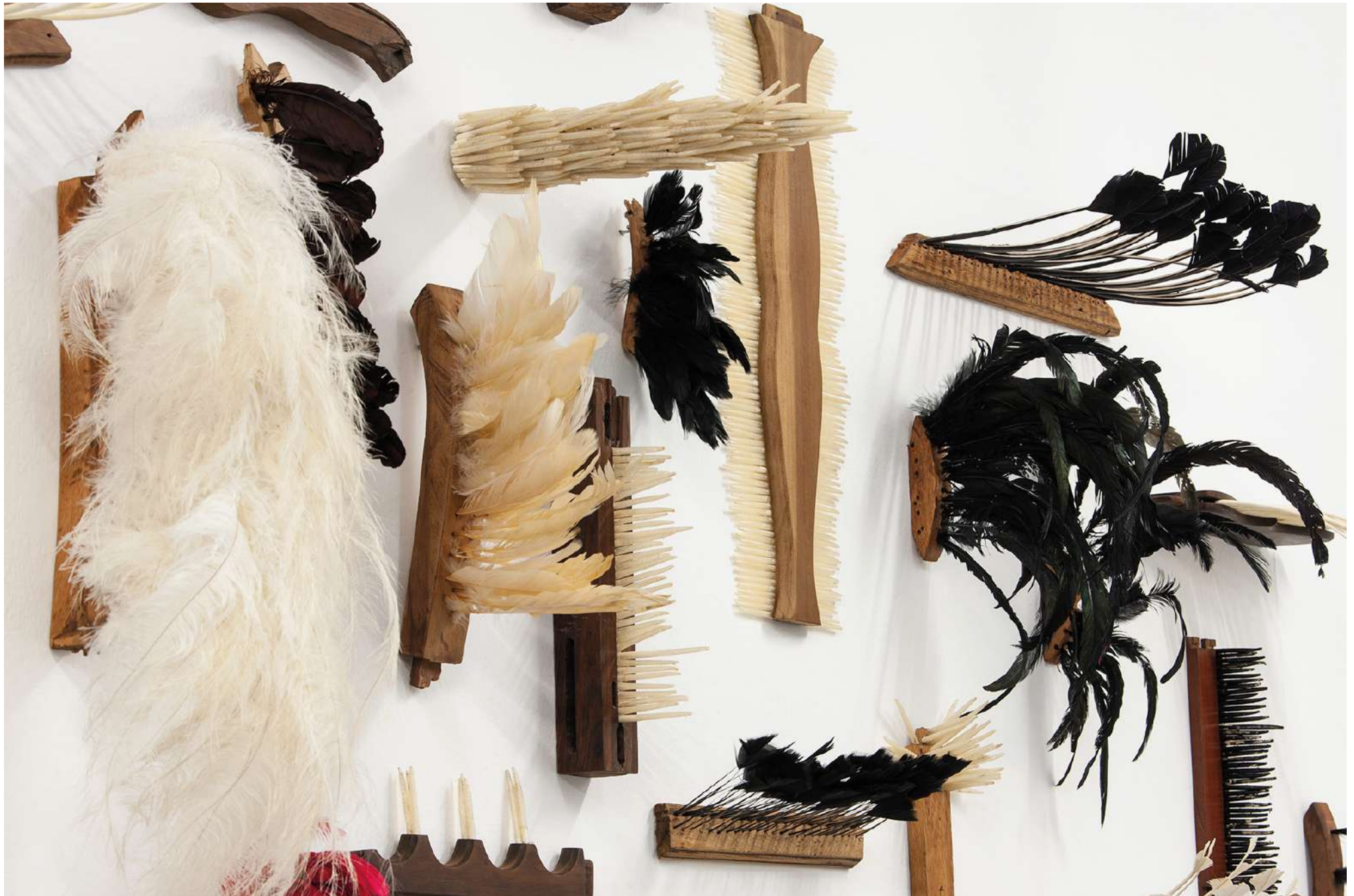
Luto Tropical, 2017 / Panel de 52 piezas en pluma, madera y melena / Panel of 52 pieces in feather, wood and mane / Variable measures / Colección Mercedes Vilardell, Palma de Mayorca, España