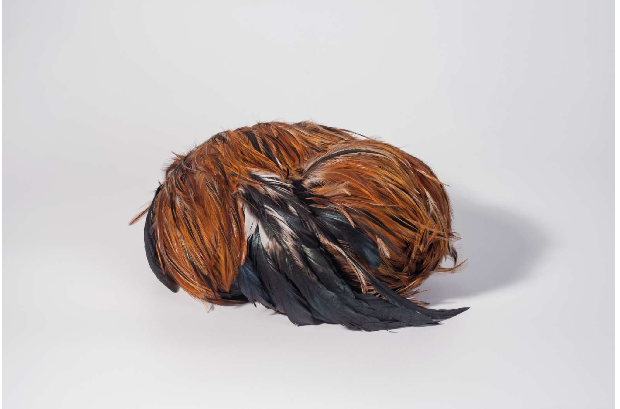
Sin título, 2018 / Plumas / Feathers / 20 x 35 x 20 cm