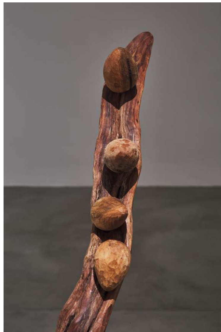
Caramujo, 2021 Oiti, eucalipto 87 x 29 x 110 cm Colección Instituto Inhotim Minas Gerais, Brasil