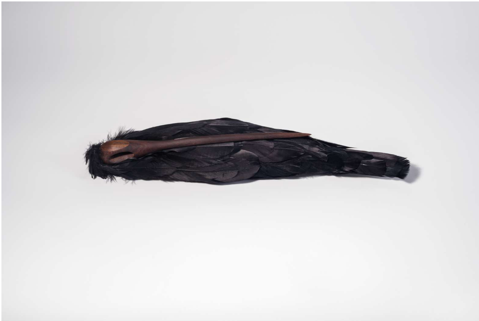
Repousário, 2017 / Escultura de plumas y madera/ Feather and wooden sculpture / Variable measures