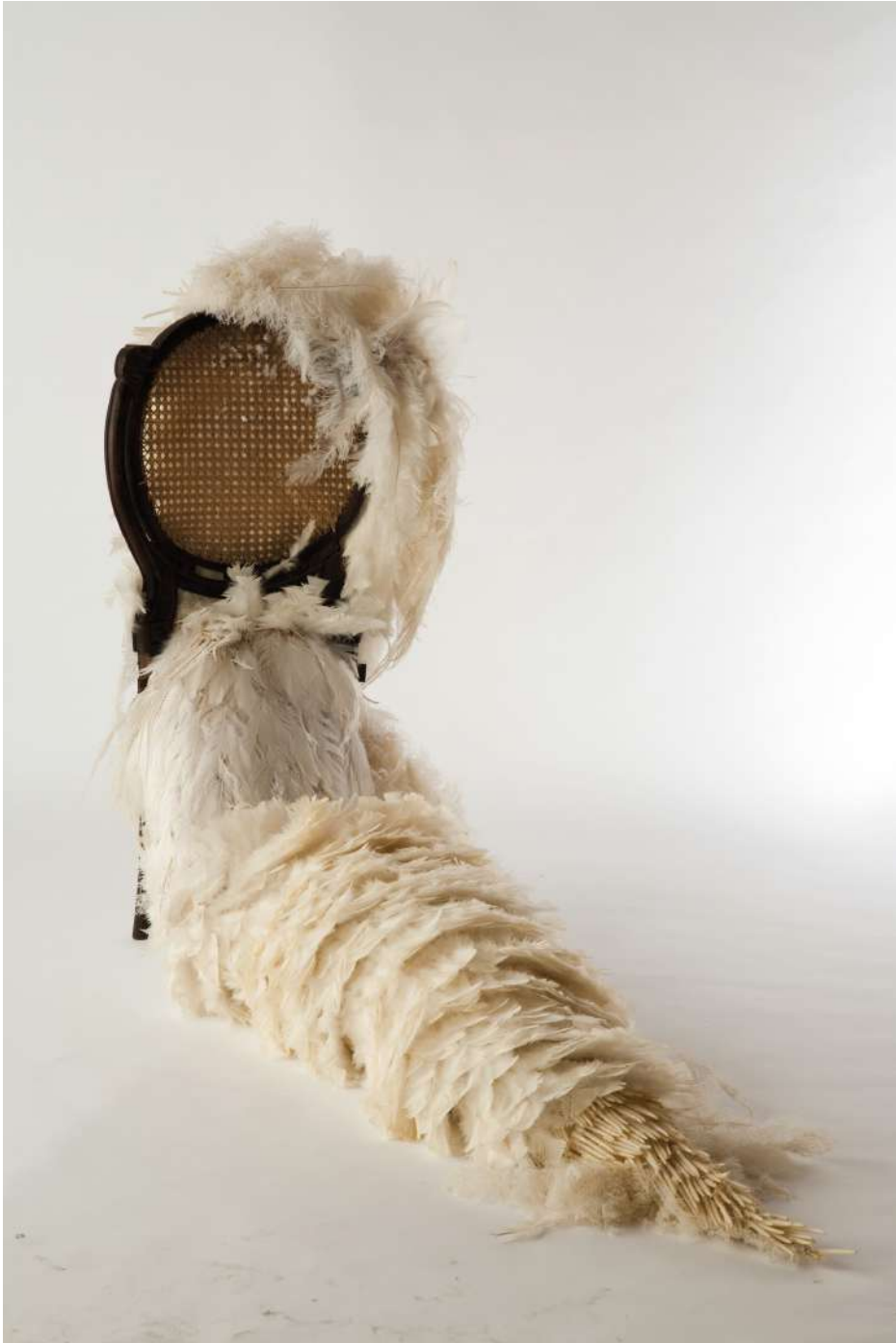
Cadeira, 2010 Escultura de plumas y mobiliario Feather sculpture and furniture 100 x 70 x 170 cm