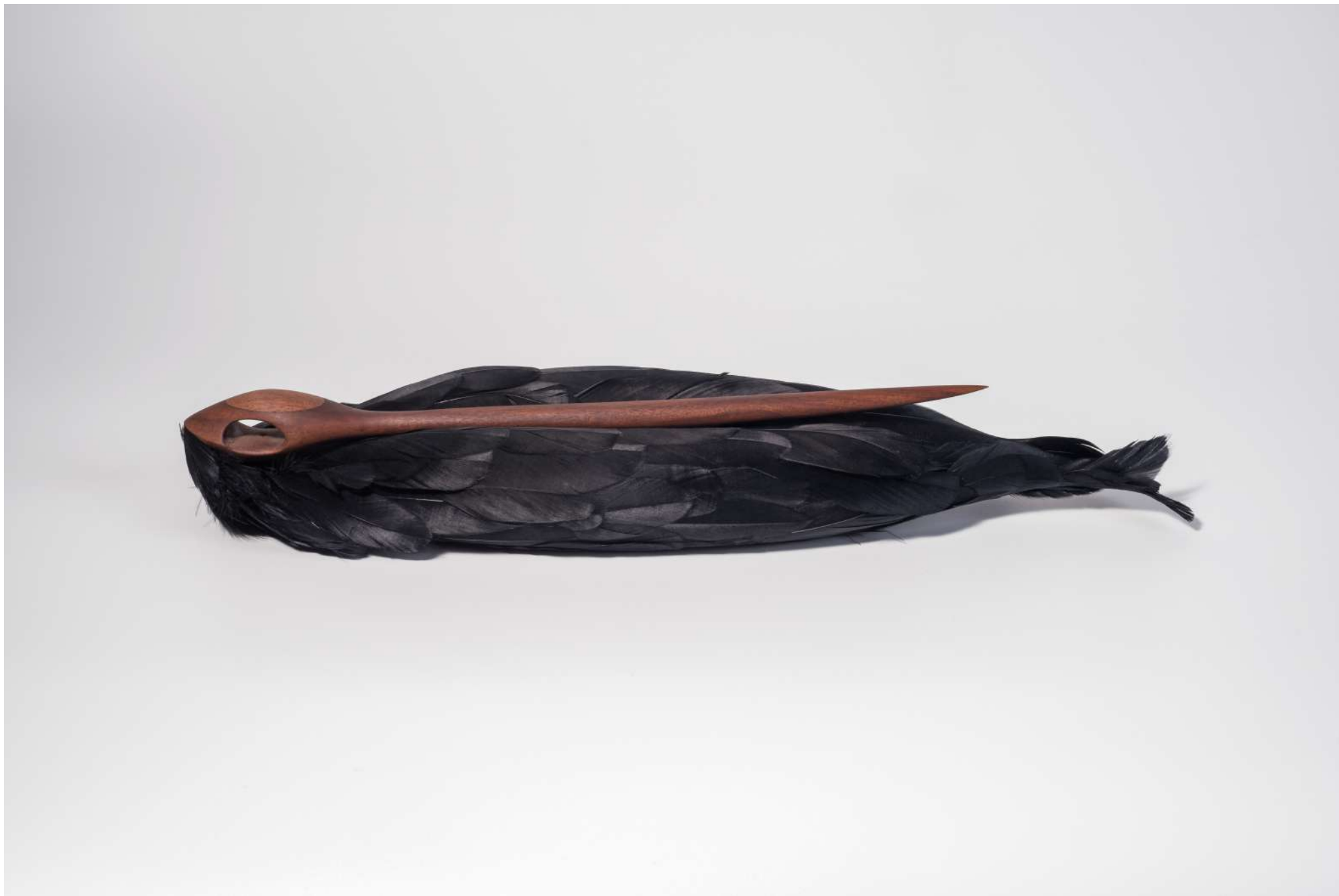
Repousário, 2017 / Escultura de plumas y madera/ Feather and wooden sculpture / 10 x 13 x 45 cm