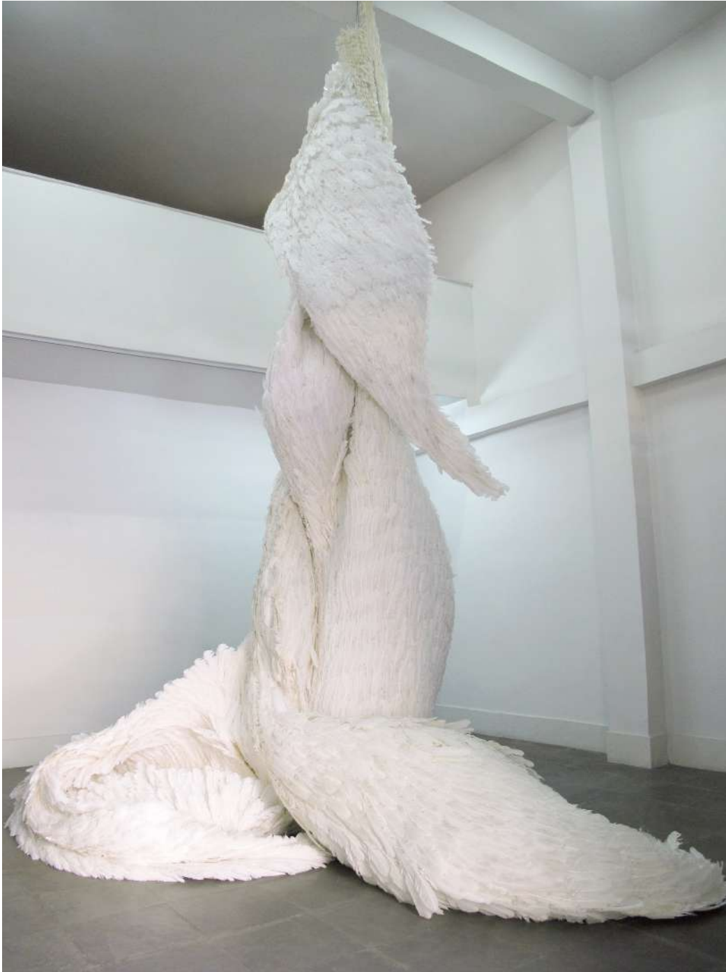
Gira, 2013 Escultura de plumas Feather sculpture 650 x 300 cm