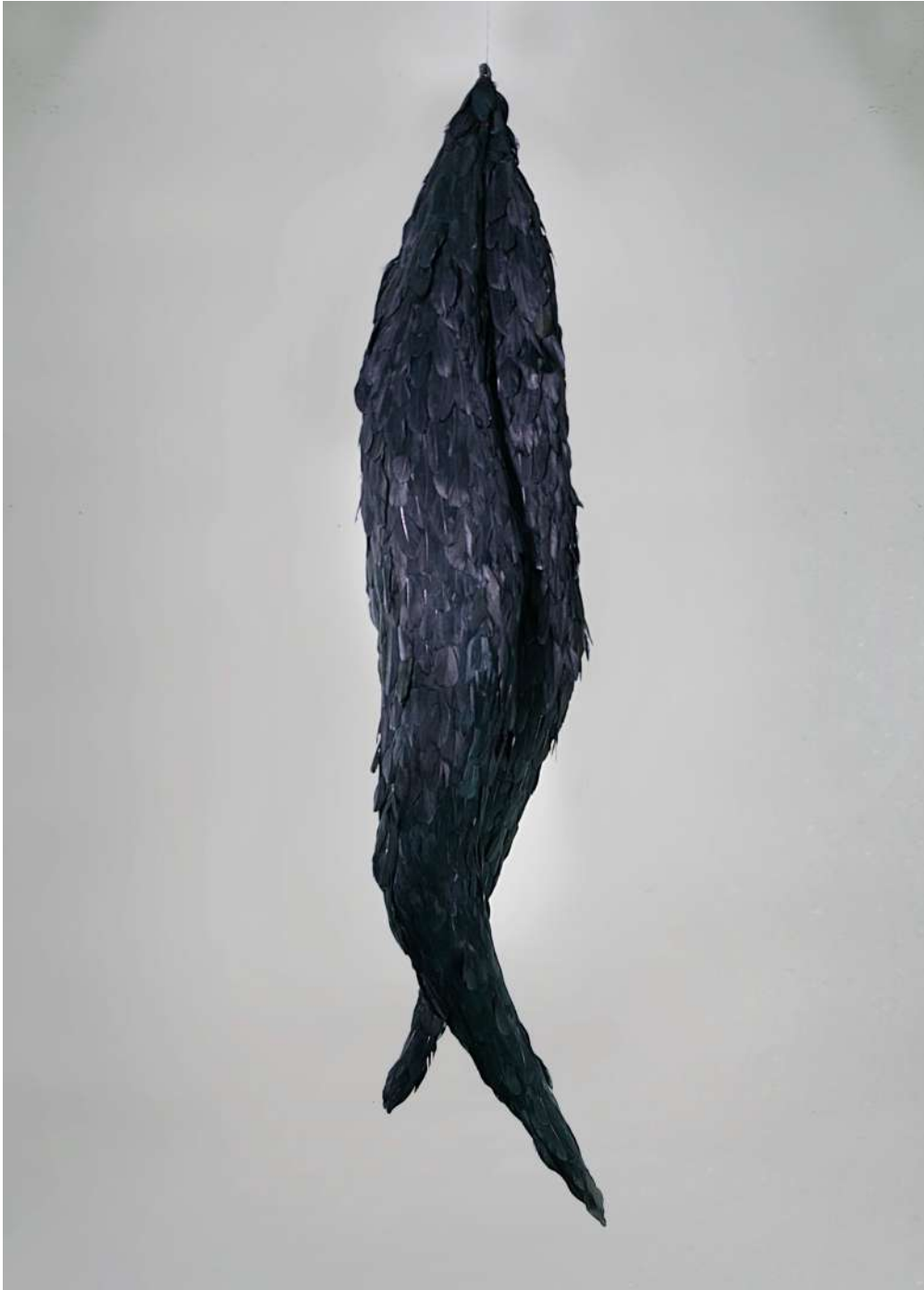
Pássaro, 2017 Escultura de plumas Feather sculpture 175 x 40 x 30 cm