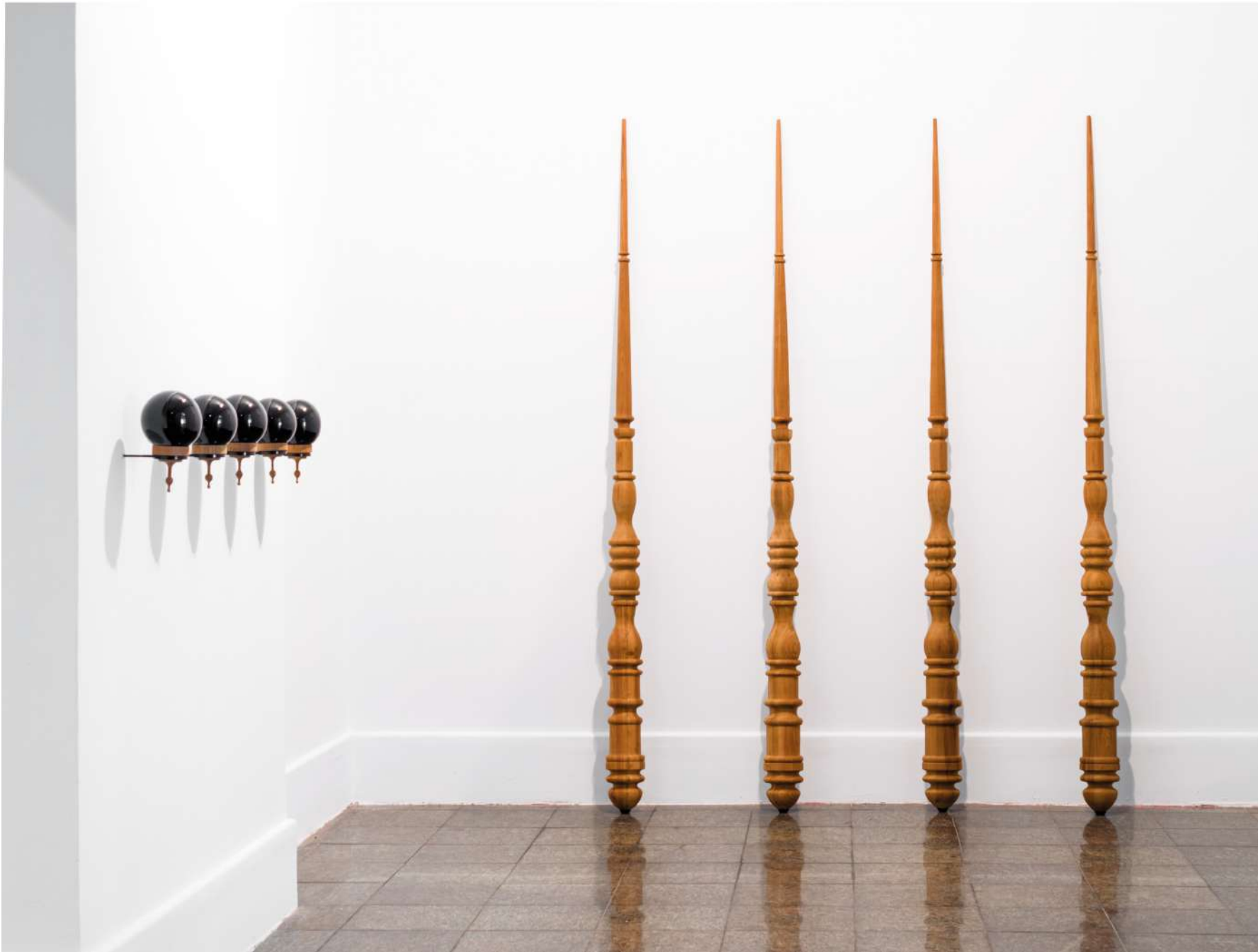
Jogo, 2013 / Installation / Dimensiones variadas / Variable measurements / Colección MAM - Museo de Arte Moderno de Río