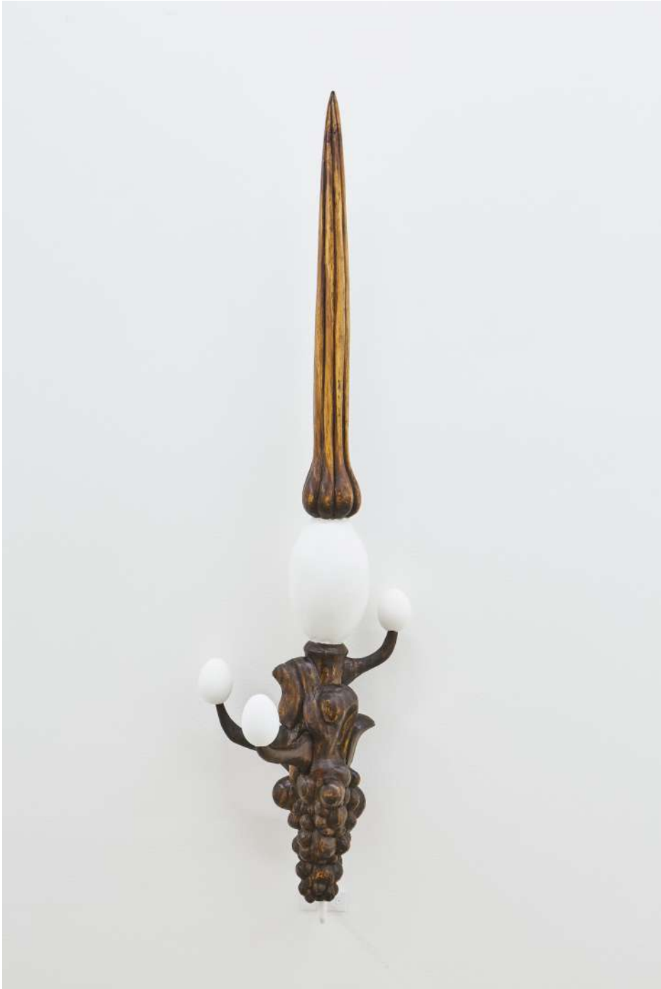
Porto da Folha, 2021 Eucalipto y pino 167 x 22 x 27 cm Colección Instituto Inhotim Minas Gerais, Brasil