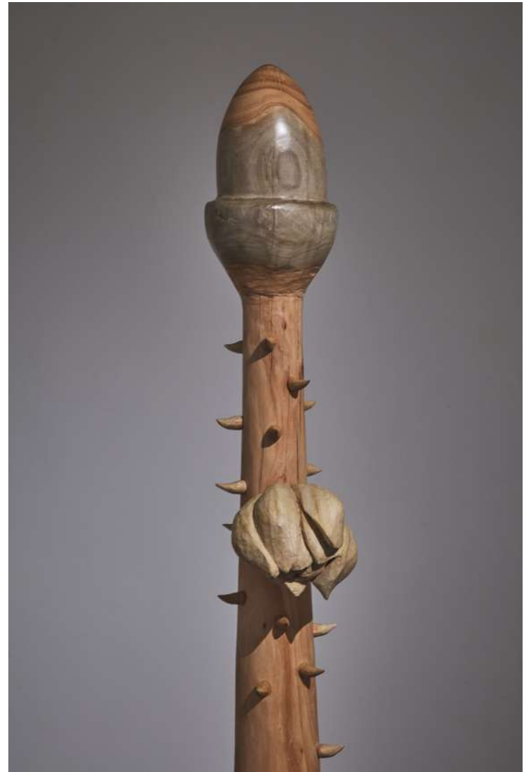
Porto da Folha, 2021 Eucalipto y pino 167 x 22 x 27 cm Colección Instituto Inhotim Minas Gerais, Brasil