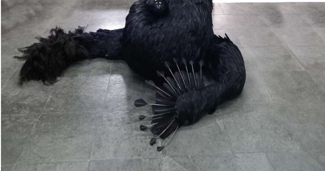
Monstra, 2020 Plumas, algodón y madera Feathers, cotton and wood 255 x 220 x 160 cm