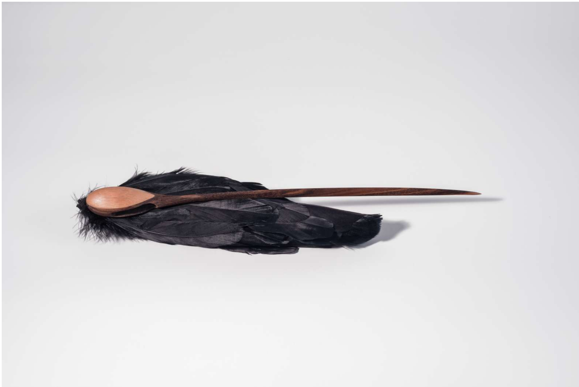
Repousário, 2017 / Escultura de plumas y madera/ Feather and wooden sculpture / Variable measures