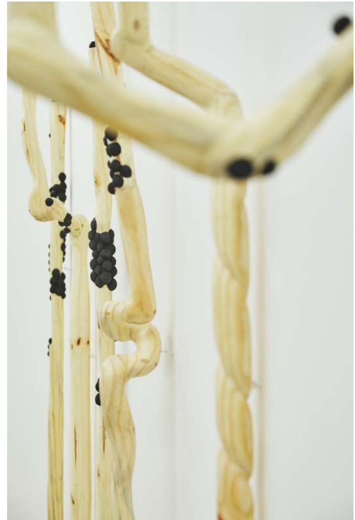
Porto da Folha, 2021 Eucalipto y pino 167 x 22 x 27 cm Colección Instituto Inhotim Minas Gerais, Brasil