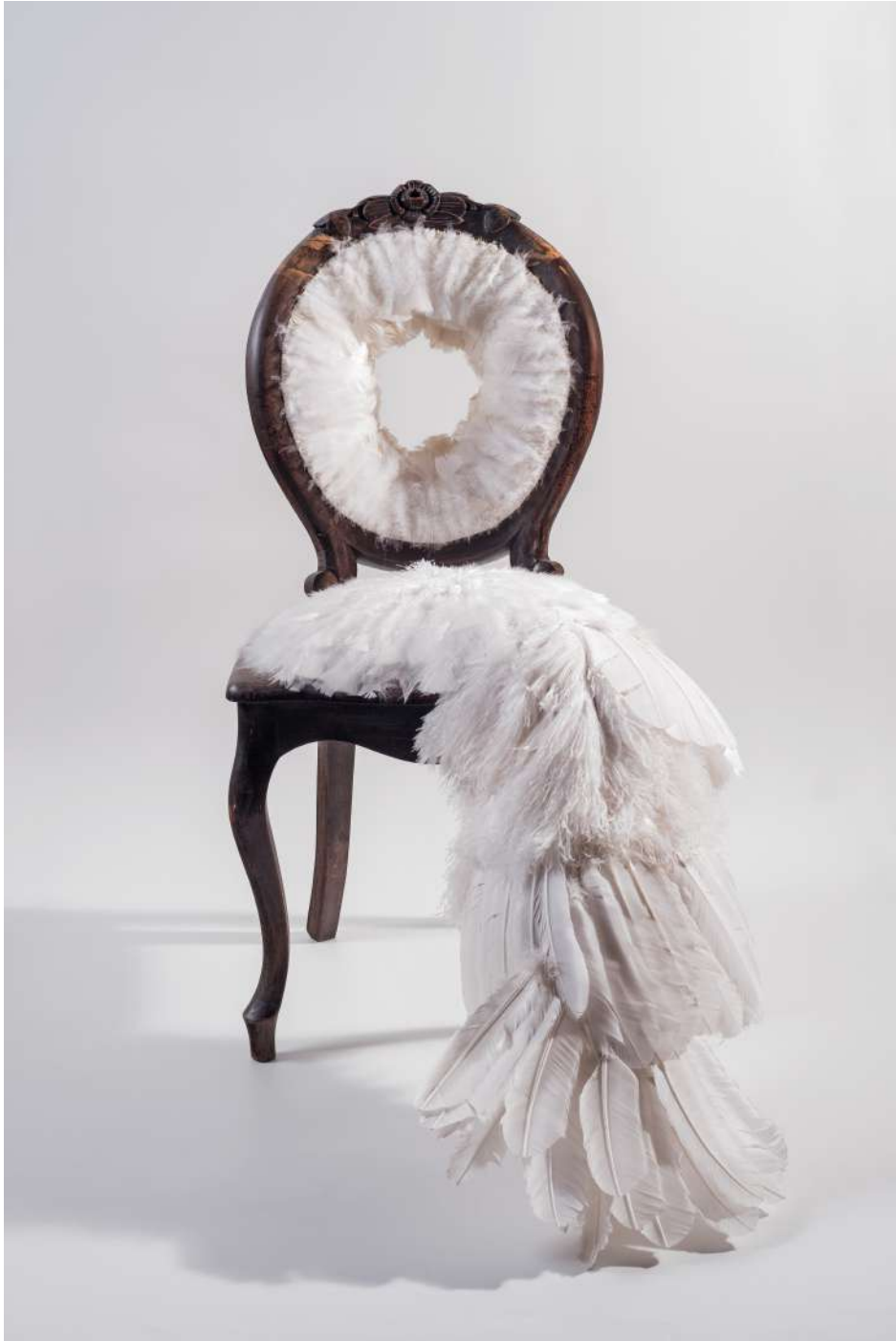
Cadeira, 2009 Escultura de plumas y mobiliario Feather sculpture and furniture 100 x 80 x 100 cm