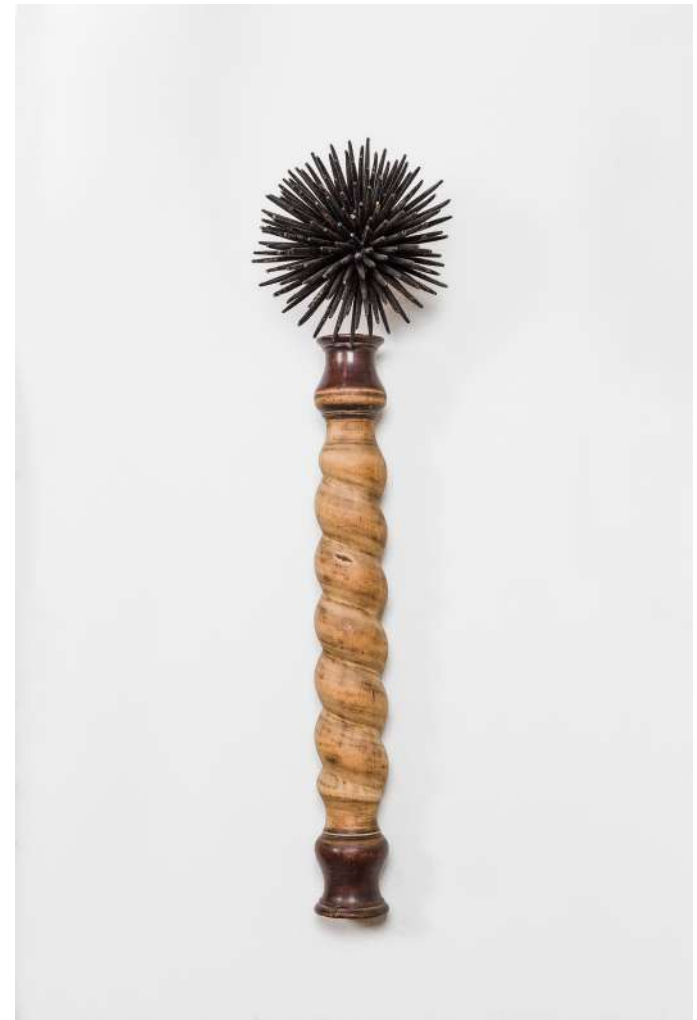
Sin título, 2020 13 piezas de madera de mobiliario, crin y cálamo de pluma 200 x 200 cm