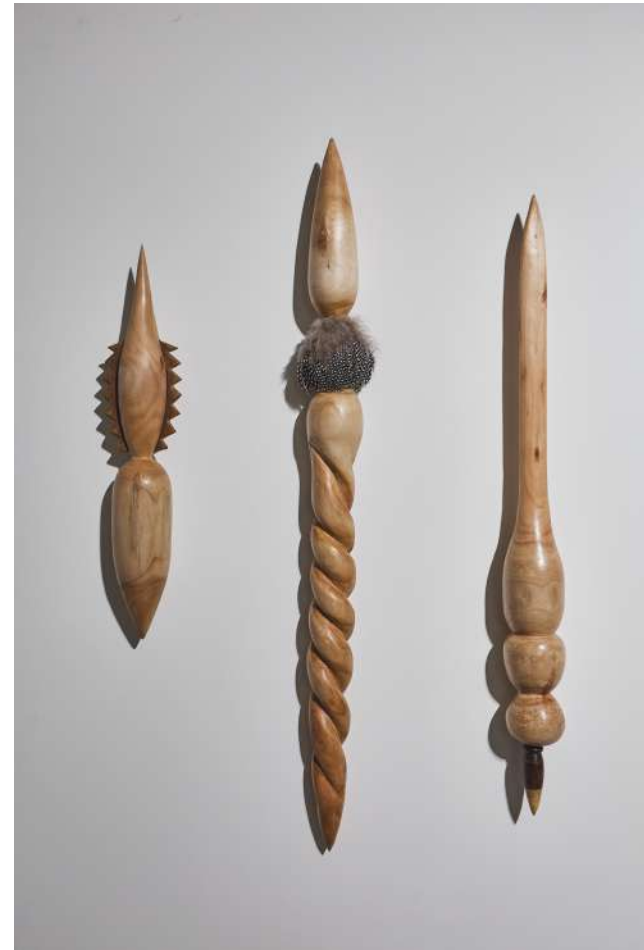
Capote, 2021 Instalación Madera y plumas de gallina capote 150 x 320 x 10 cm