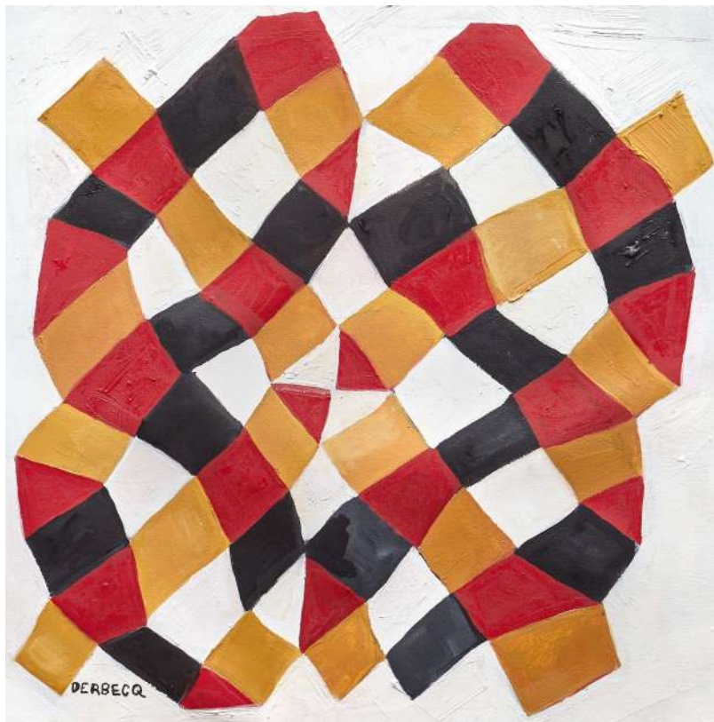
Germaine Derbecq, 2018 Óleo sobre tela, 32 x 31 cm