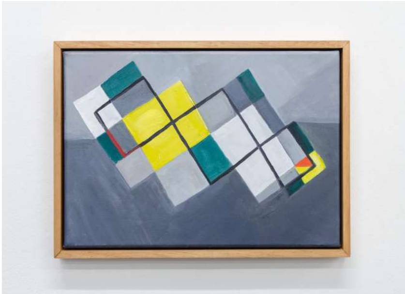
Yente, 2018 Óleo sobre tela, 27 x 38 cm