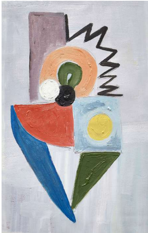
Sonia Delaunay, 2017 Óleo sobre tela, 25 x 15 cm