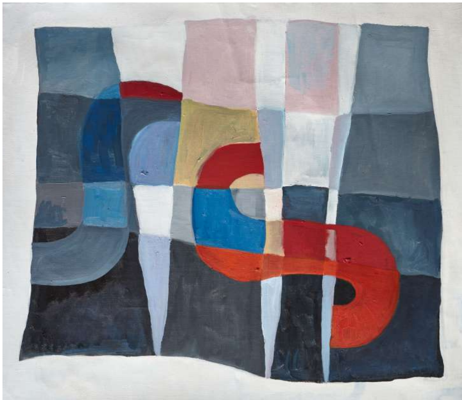
Sophie Taeuber, 2017 Óleo sobre tela, 34 x 40 cm