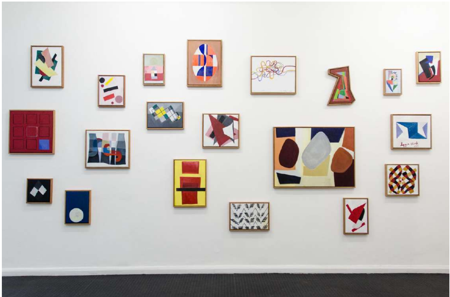
Vista General de la exhibición.