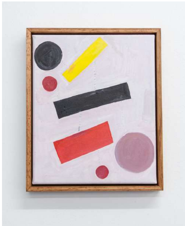
Diyi Laañ, 2018 Óleo sobre tela, 33,5 x 28 cm