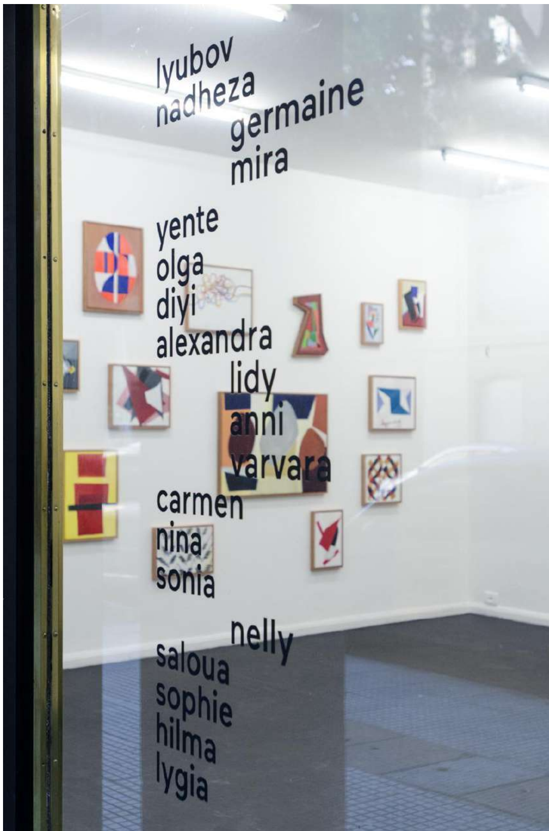
Vista General de la exhibición.