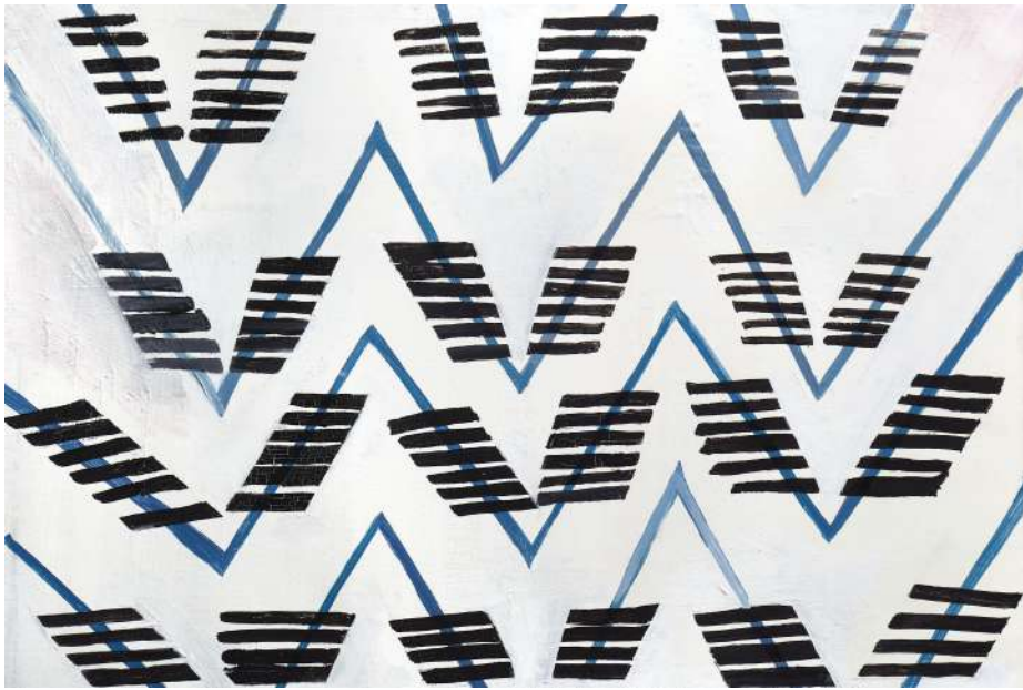
Varvara Stepanova, 2018 Óleo sobre tela, 26,8 x 39,5 cm