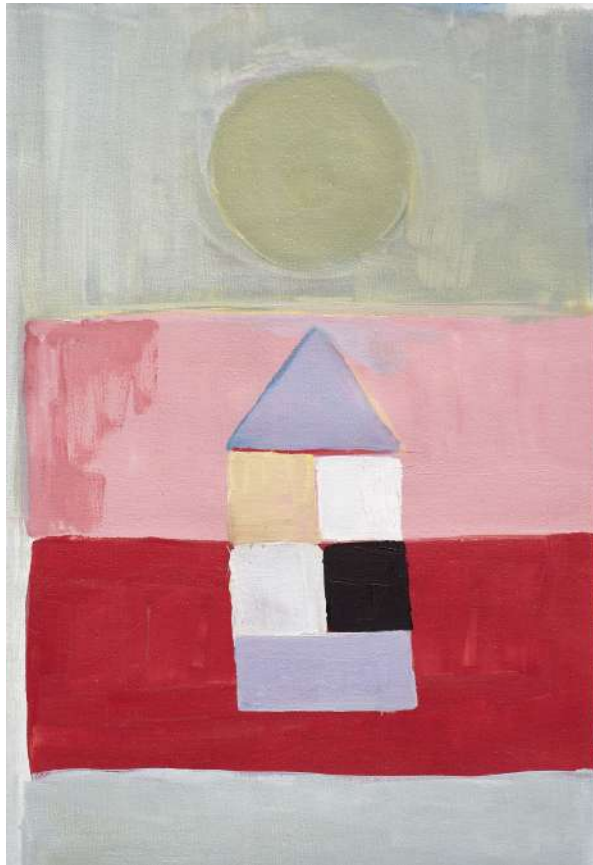
Hilma af Klint, 2017 Óleo sobre tela, 33,5 x 28 cm