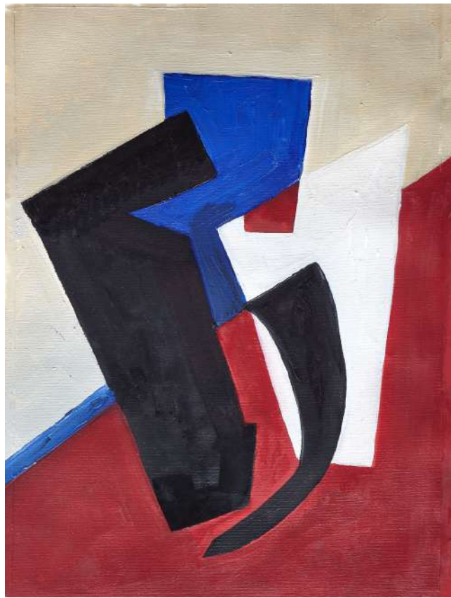
Alexandra Ekster, 2018 Óleo sobre tela, 31 x 22,5 cm