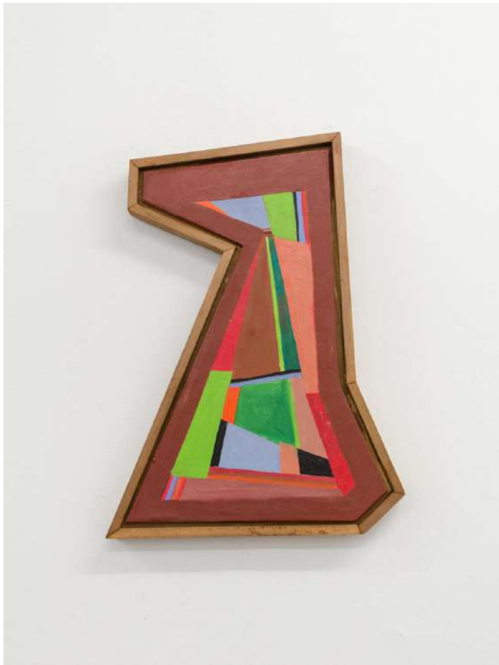
Nelly Esquivel, 2018 Óleo sobre tela, 38 x 27 cm