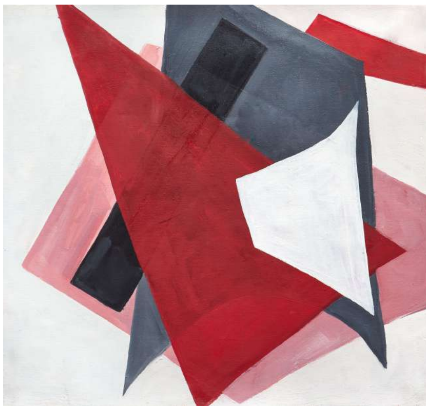
Lyubov Popova, 2017 Óleo sobre tela, 35 x 37 cm