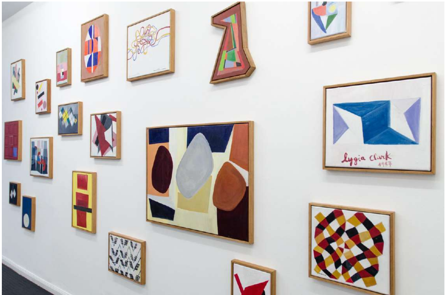
Vista General de la exhibición.