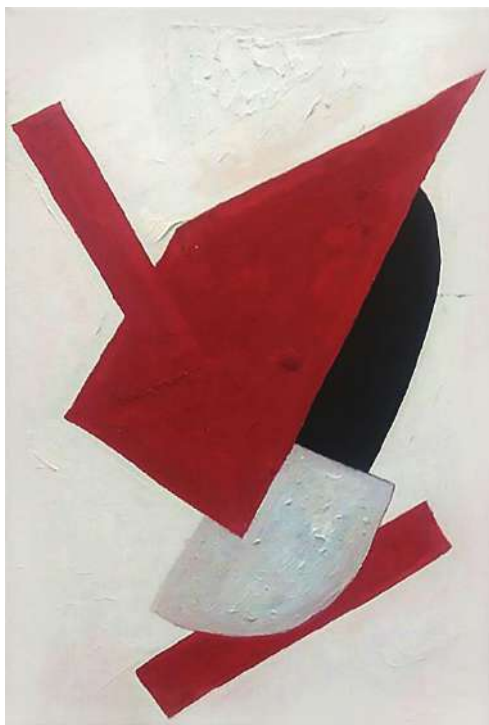
Genke Meller, 2018 Óleo sobre tela, 28 x 26 cm