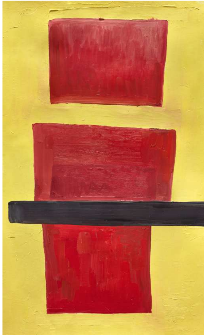
Olga Rozanova, 2017 Óleo sobre tela, 53 x 32 cm