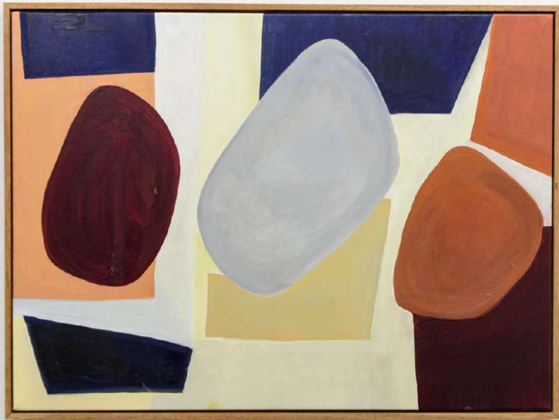
Saloua Raounda Choucair, 2018 Óleo sobre tela, 40 x 46 cm