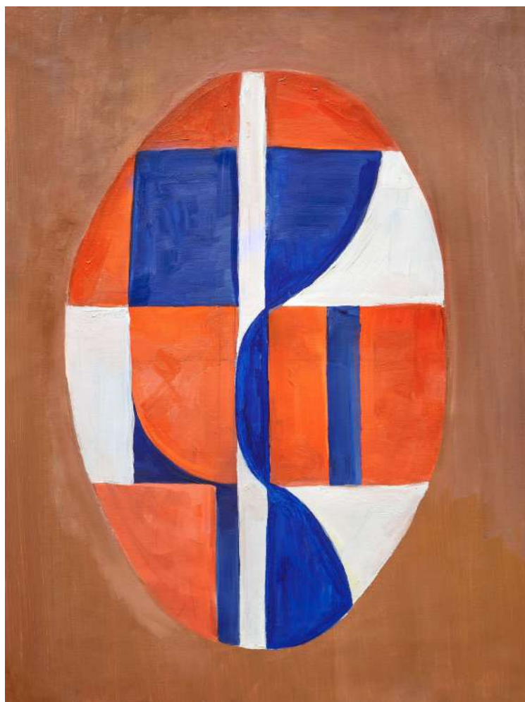
Carmen Herrera, 2018 Óleo sobre tela, 47 x 36 cm