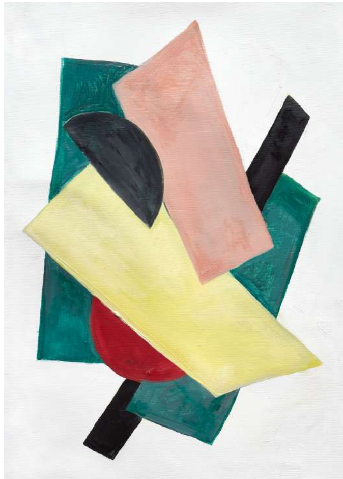
Nadezhda Udaltsova, 2018 Óleo sobre tela, 40 x 30 cm