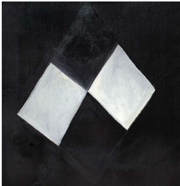
Mira Schendel, 2017 Óleo sobre tela, 23 x 23 cm