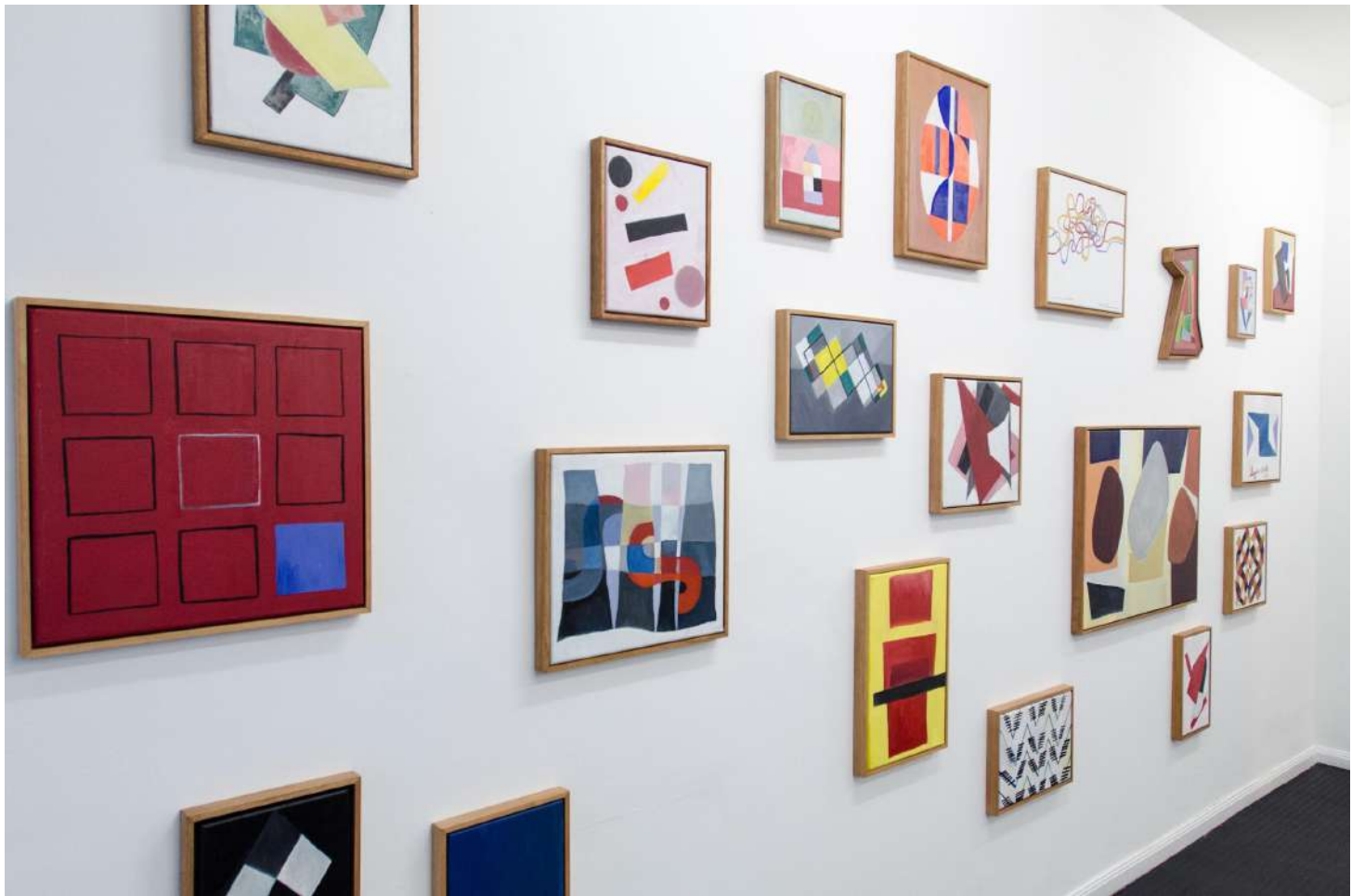
Vista General de la exhibición.