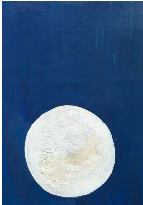
Mira Schendel, 2017 Óleo sobre tela, 33 x 24 cm